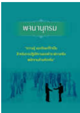
หนังสือ ความรู้ และทักษะที่จำเป็น สำหรับการปฏิบัติ งานของข้าราชการหรือพนักงานส่วนท้องถิ่น