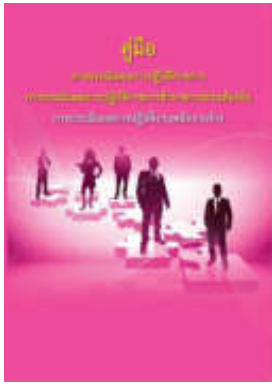
หนังสือ การประเมินผลการปฏิบัติงานพนักงานจ้าง