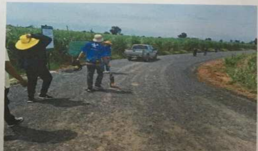
ภาพถ่ายประกอบการตรวจรับงานจ้าง โครงการก่อสร้างถนนคอนกรีตเสริมเหล็ก จากศาลาประชาคม หมู่ 4 ถึง สามแยกบ้านคลองแคใต้ หมู่ 4 ตำบลโนนเมืองพัฒนา อำเภอด่านขุนทด จังหวัดนครราชสีมา วันศุกร์ ที่ 26 มกราคม 2567